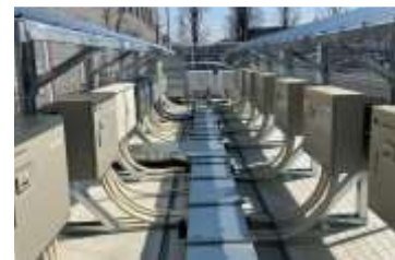
パワーコンディショナーなど