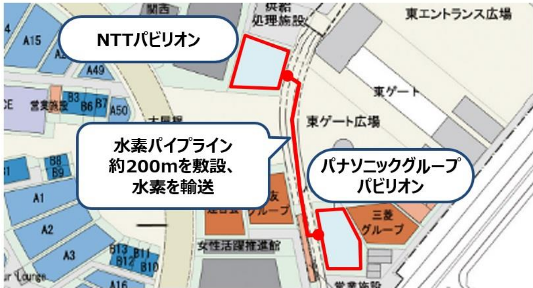
NTT パビリオン-パナソニックグループパビリオン間の水素パイプライン敷設ルート