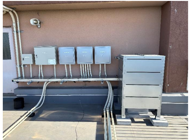
パワーコンディショナ・蓄電池等